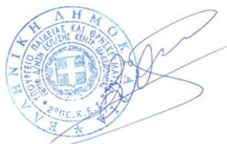
Δρ. Όλγα Βασιλειάδου